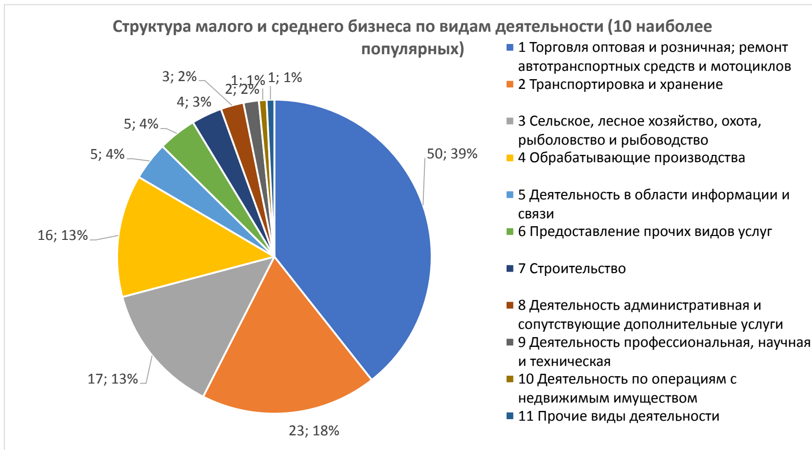
График 2. Структура малого и среднего предпринимательства в муниципальном образовании – Ершичский район Смоленской области по видам деятельности

Относительно невысокий темп прироста количества ИП может быть связан с растущей популярностью применения статуса плательщика налога на профессиональный доход (самозанятость) среди физических лиц, осуществляющих коммерческую деятельность. Благодаря простой регистрации и невысокой налоговой нагрузке большое количество предпринимателей предпочитает этот режим регистрации классического ИП.